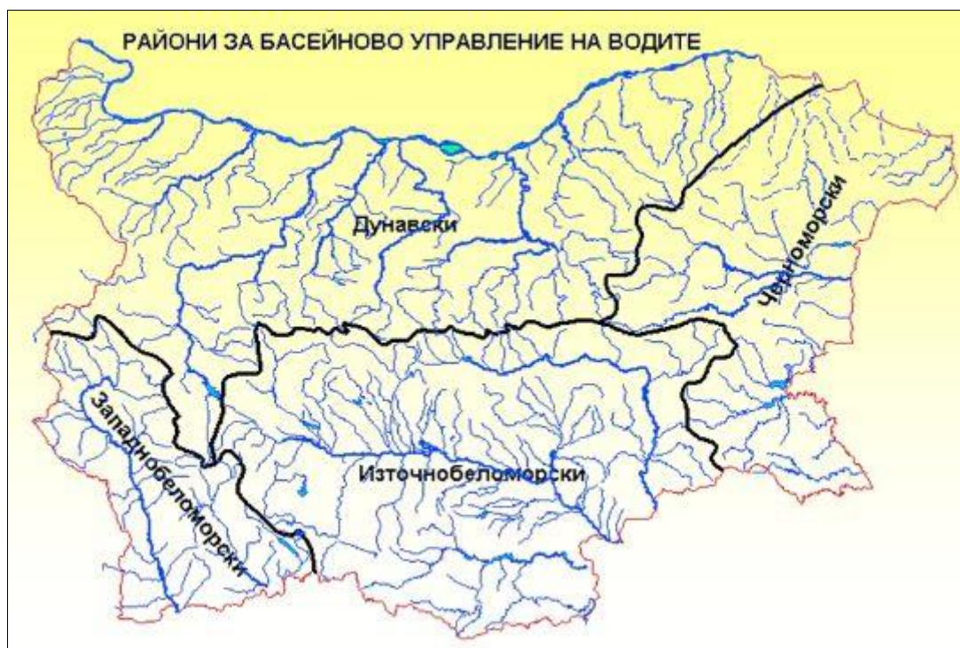
Фигура 5 – Четирите района за басейново управление на водите в Република България

Четири района за басейново управление на водите в Република България са показани на Фигура 5: