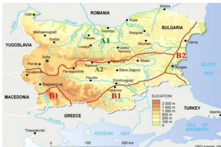
Фигура 1– Климатични райони в България.

Територията на България спада към две климатични области: европейско-континентална и континентално-средиземноморска климатична области (източник: Л. Събев, Св. Станев, 1959; Ж. Гълъбов, 1982). Климатичните райони в България са представени на Фигура 1.