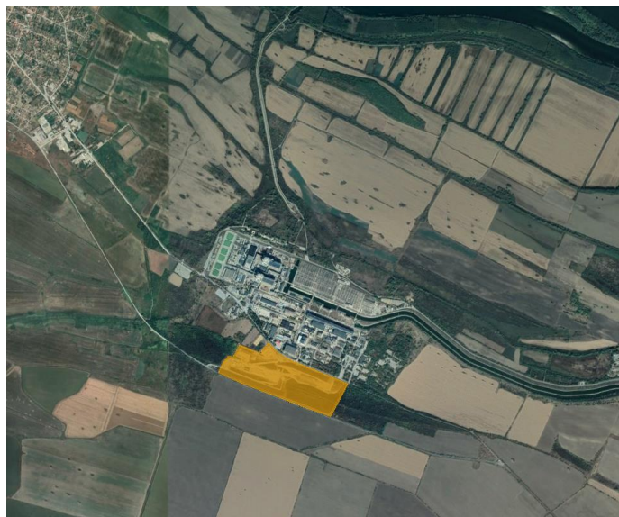
Фигура 2 – Площадка на АЕЦ „Козлодуй“ и площадка на НХРАО „Радиана“ (контурът в оранжево).

Климатът в този район се характеризира като подчертано континентален поради резкия контраст между зимните и летните топлинни условия. Средната годишна амплитуда на температурата на въздуха е между 24.5°C и 26°C – най-голямата за цялата страна. Континенталният характер на климата се потвърждава и от режима на валежите в района. Годишната им сума е между 540 mm и 580 mm, като максимумът е през юни, а минимумът – през февруари. Разликата между валежната сума за трите летни и трите зимни месеци е между 70 mm и 120 mm, т.е. 15% – 20% от годишната им сума. Абсолютните максимални денонощни валежи са през лятото със стойности около 100 mm – 130 mm. Летните валежи обаче се групират в отделни дни и особено през втората част на лятото твърде често има засушавания. През лятото и есента средно има по 4 – 5 безвалежни периода с продължителност над 10 дни и средна продължителност 16 – 20 дни. В отделни години нередко се случват и много по-продължителни засушавания.